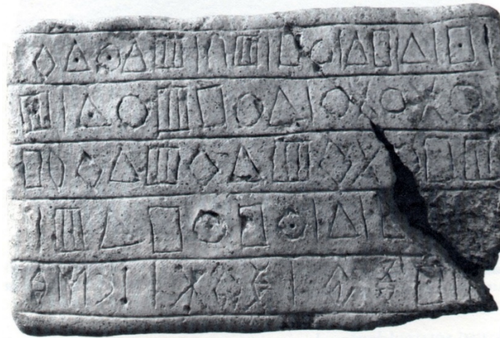
Tavoletta trovata a Konar Sandal Sud: iscrizione in caratteri geometrici, la riga più in basso è in Elamico Lineare